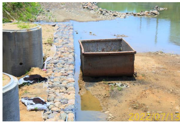
圖 3、工區內施工現況