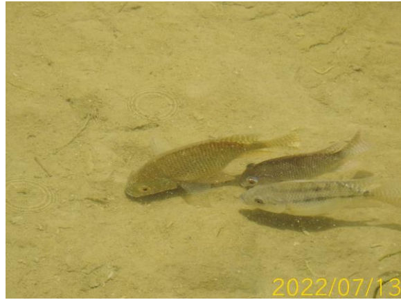
圖 1、現地水體內之吳郭魚