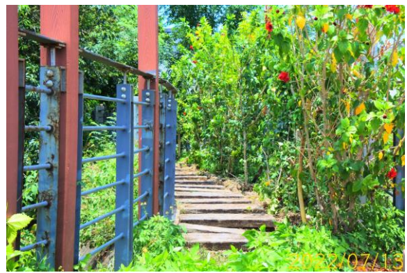
圖 4、週邊既有植栽現況