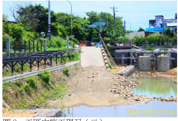
圖 8、工區內施工現況（二）