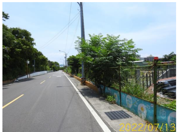
圖 12、工區圍籬設置情況