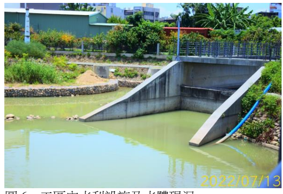
圖 6、工區內水利設施及水體現況