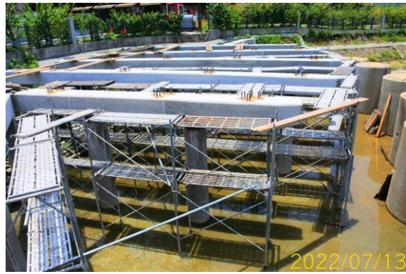
圖 9、工區內施工現況（三）