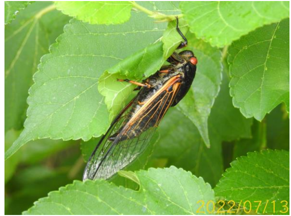
圖 2、工區旁之紅脈熊蟬