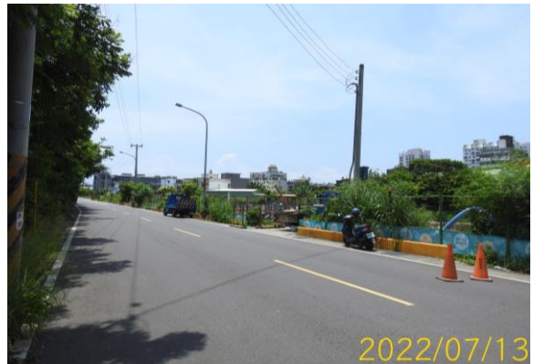
圖 10、工區週邊圍籬明確設置