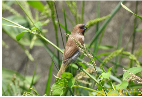
圖 7、工區旁之覓食中斑文鳥