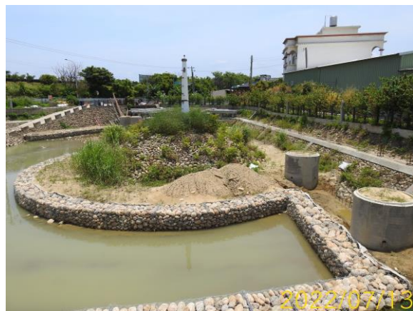
圖 11、工區內人工島現況