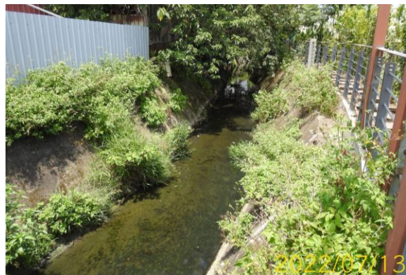
圖 5、鄰近之水體（民生污水排放）